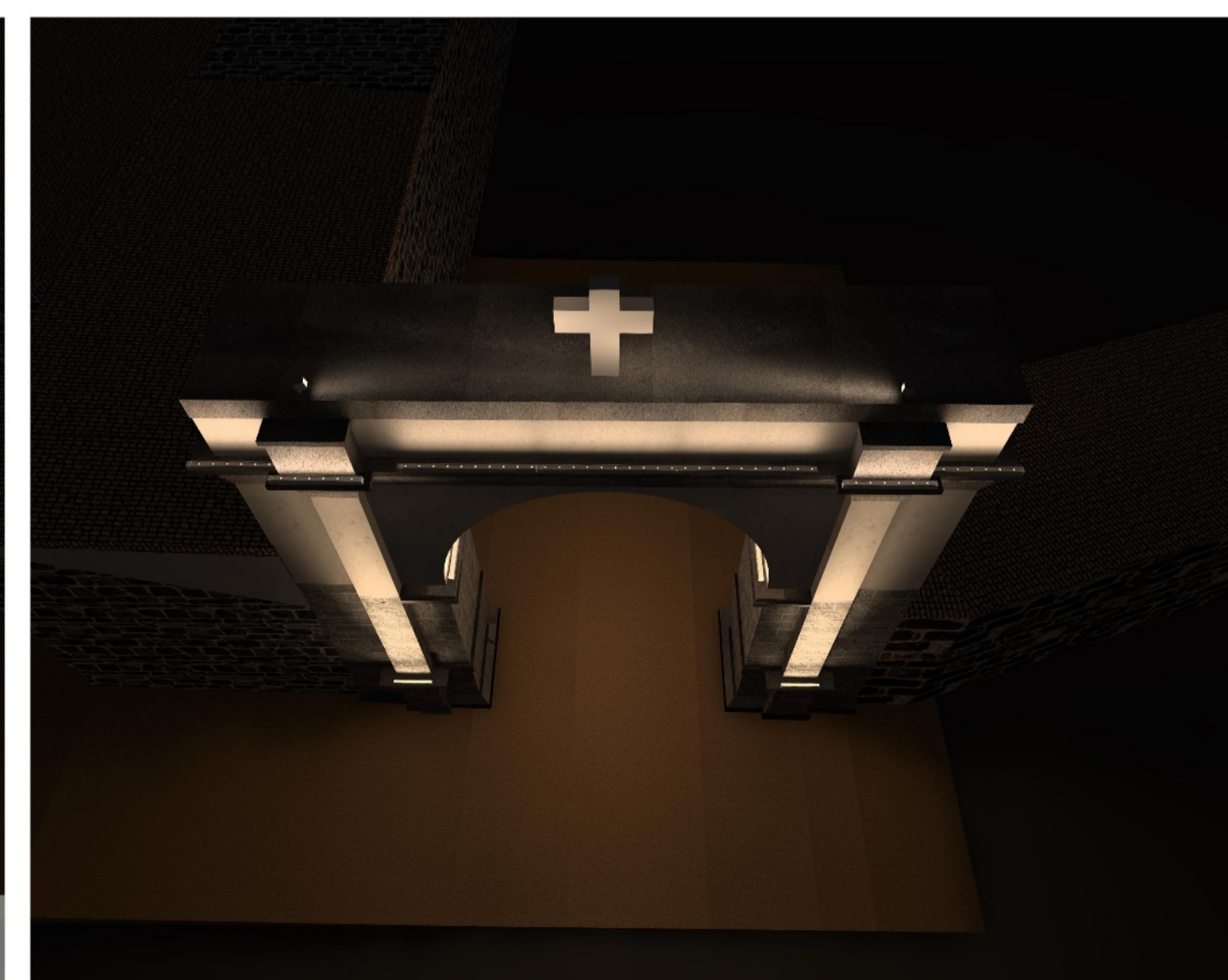
VISTE SIMULAZIONE ILLUMINAZIONE NOTTURNA

*Affidamento in concessione del servizio energia e gestione integrata degli impianti di illuminazione pubblica di proprietà del Comune di Sedilo, attraverso un Partenariato Pubblico Privato (PPP) ai sensi dell'art. 180, comma 8 e art. 183, comma 15 del D. Lgs. n° 50/2016, così come modificato ed integrato dal D. Lgs. n° 56/2017